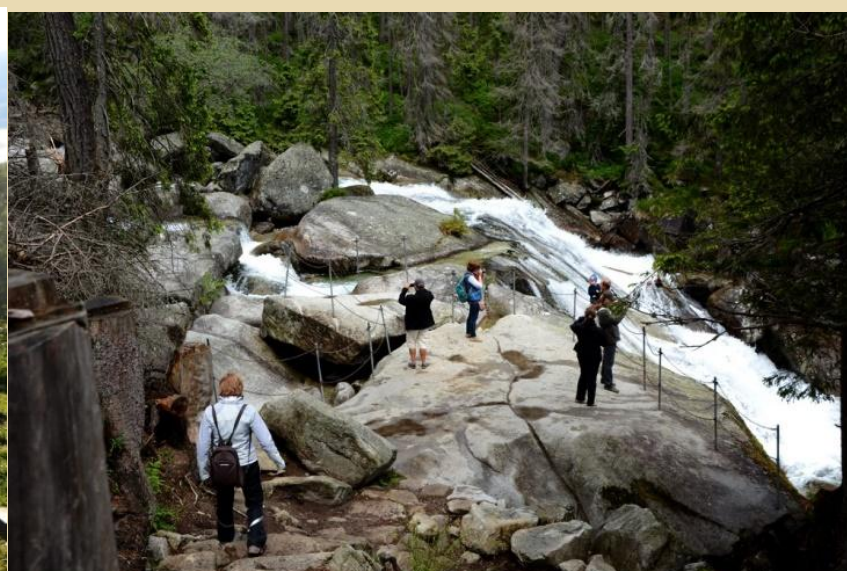
Živinoreja je na prvem mestu. Morda imajo tudi svojega Kekca. Nešteto slapov še polepša pokrajino.