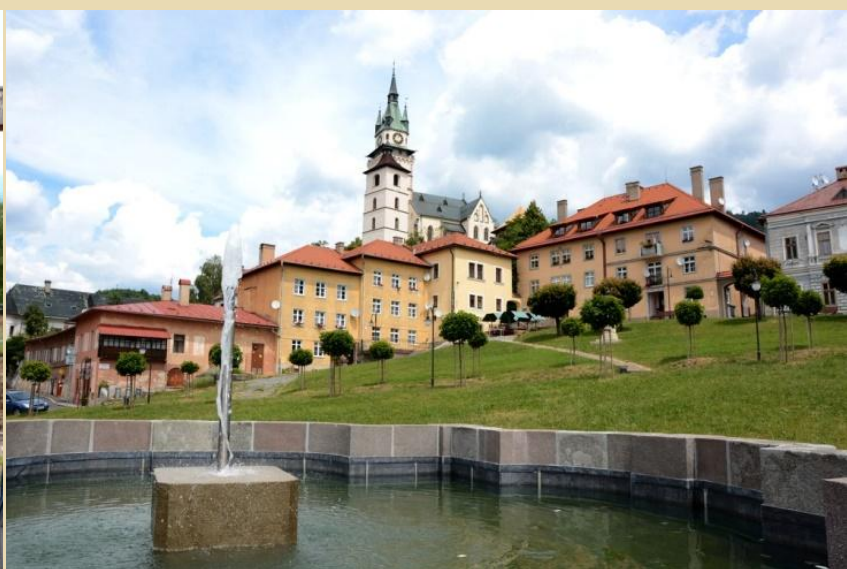
Turizem je na vsakem koraku, saj imajo veliko lepot.