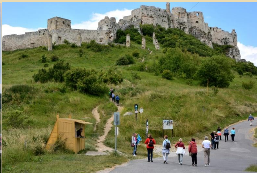
Nad mesti in trgi kraljujejo gradovi.