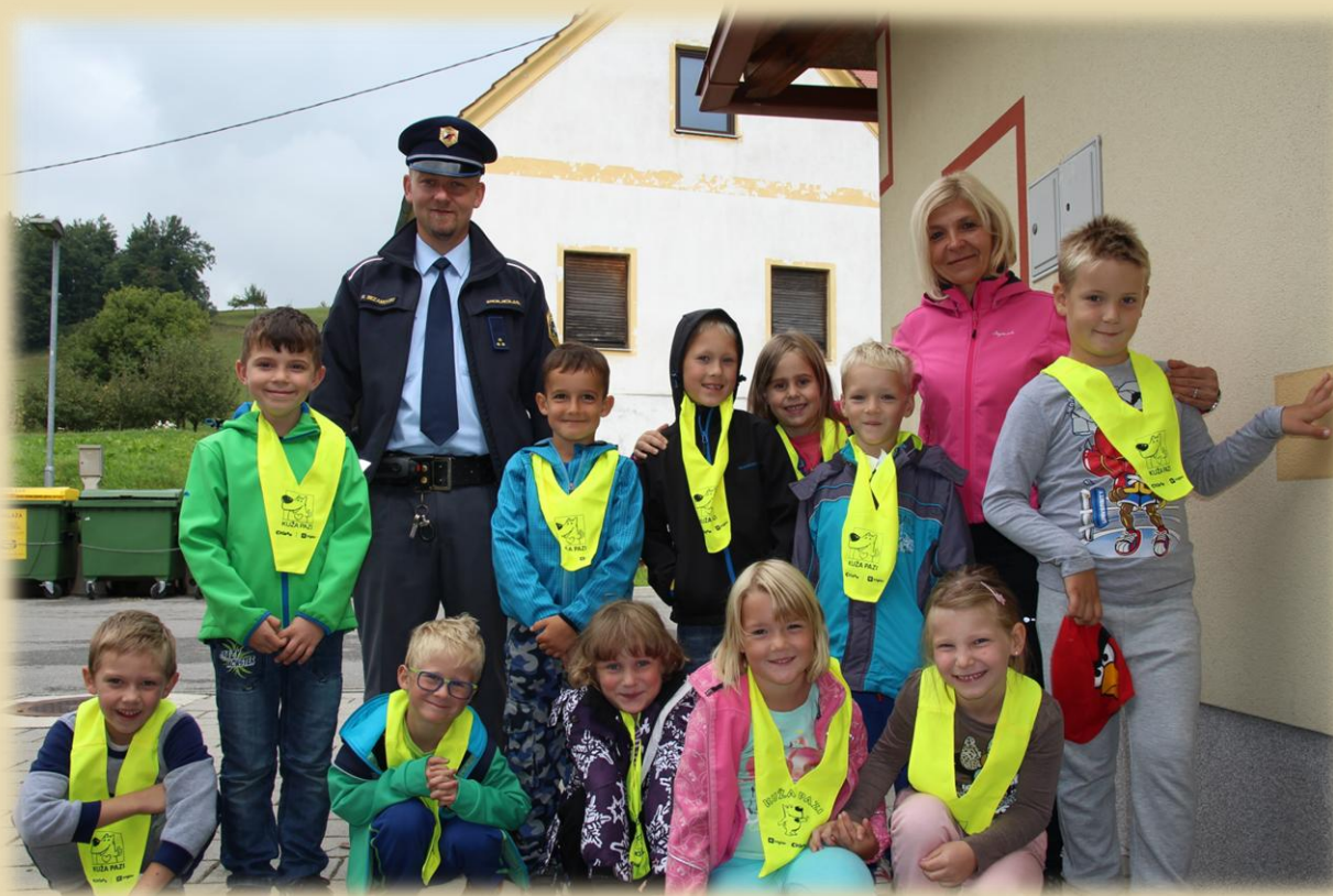
Učenci in kolektiv PŠ Šentrupert

A gospod policist sploh ni bil tako strog. Bil je prijazen, nasmejan in zelo zabaven. Vsekakor pa bomo dosledno upoštevali njegove nasvete. Na koncu smo si vsi rekli: »Srečno pot in brez nezgod.«