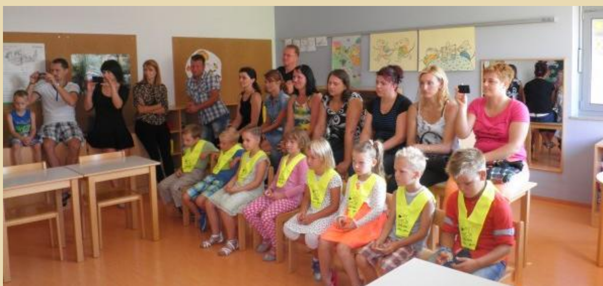
Prvošolčki so z veseljem prisluhnili in z zanimanjem opazovali, kaj vse že znajo starejši.