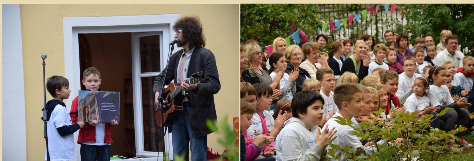
Vsestransko navdušenje ob Rolici papirja