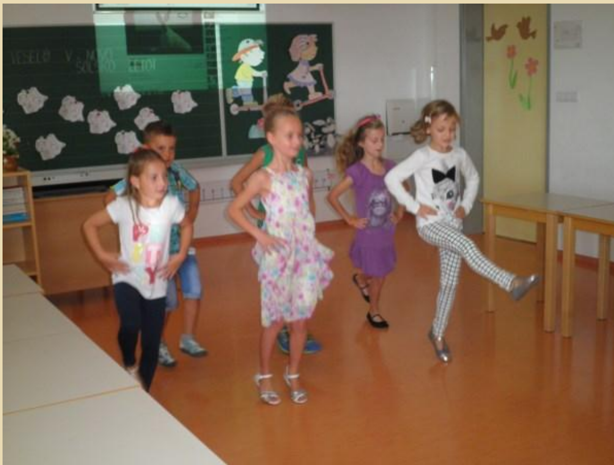
»Ta veliki« so pripravili kratek programček. Veliko se je plesalo in pelo.